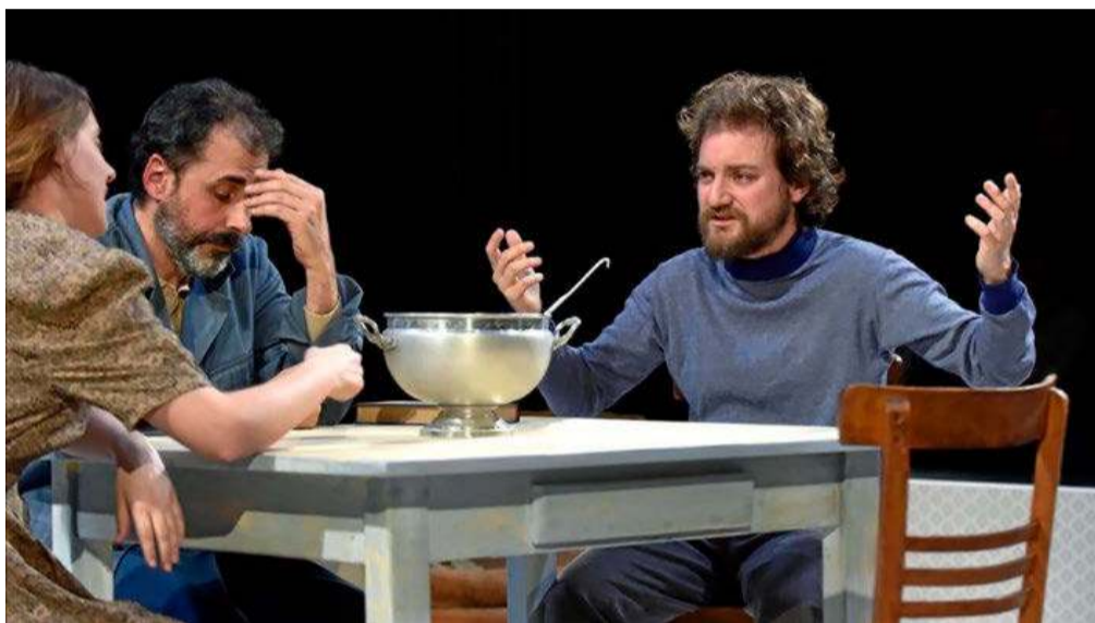
Una escena de 'Sopa de pollastre amb ordi' de Arnold Wesker , con dirección de Ferran Utzet .

El tiempo transcurre entre la manifestación antifascista del West End en Londres en 1936 y el alzamiento anticomunista de Hungría en 1956. Entre los muchos atracti-