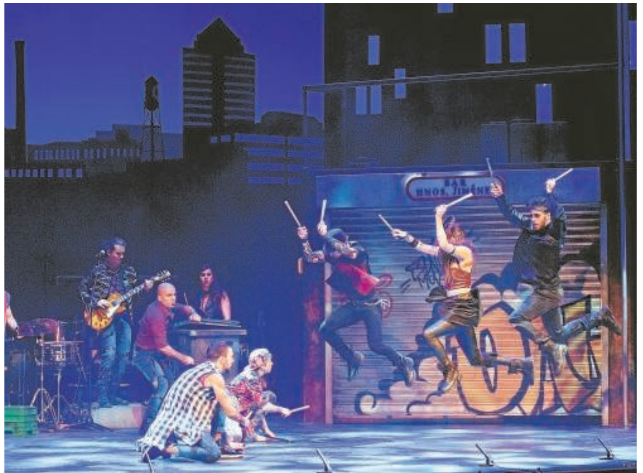
Los integrantes de Mayumana durante un momento de la representación

► Barcelona. Teatro Victoria. Hasta el 18 de marzo.